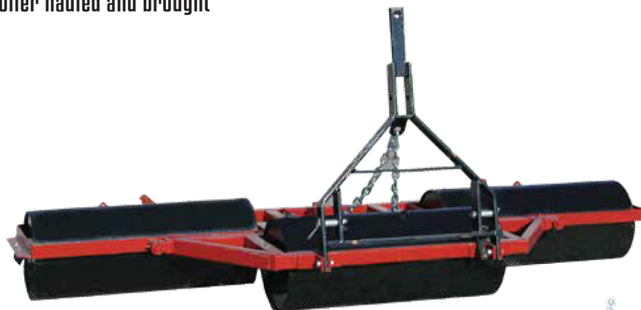
Posizione di lavoro.

Compactor track roller hauled and brought